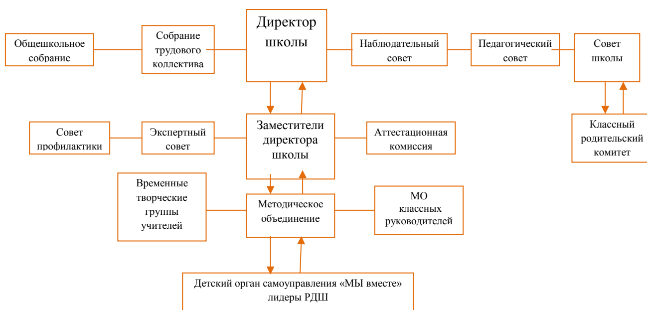
Рисунок 1 Схема организационной структуры управления МАОУ «НОШ имени В.И. Ефремовой» г. Усинска

В Школе сформированы и действуют коллегиальные органы управления: