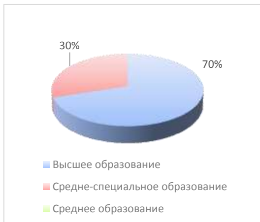
Рисунок 4 Сведения об образовании педагогических работников