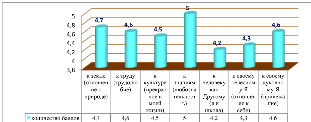
Рисунок 3. Результаты уровня развития личности учащихся МАОУ «НОШ имени В.И. Ефремовой» г. Усинска по методике Н.П. Капустина

Проводимый мониторинг показывает, что у учащихся сформировано устойчиво-позитивное отношение к природе, труду, культуре, знаниям, человеку как другому, к своему телесному и духовному Я: все показатели более 4 (при максимальных 5 баллах).